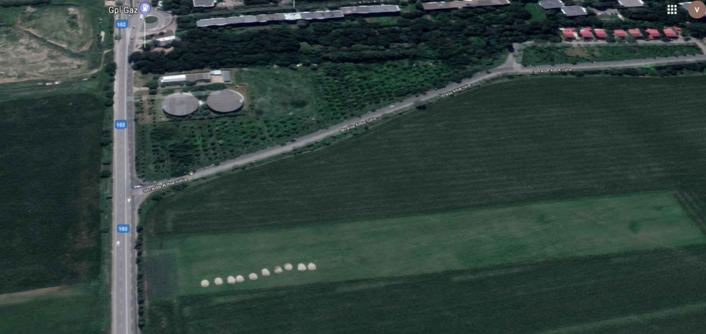
Din satelit amplasament

ELABORARE PUZ PENTRU CONSTRUIRE ANSAMBLU REZIDENTIAL; in conditiile respectarii OUG nr.7/2011 pentru modificare si completarea Legii nr.350/2001 privind amenajarea teritoriului si urbanismului publicata in M.O. nr. 111 din 11.02.2011 Mun. Ploiesti, Str. Gageni nr. Cad. 14382